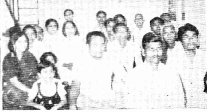
यह चित्र बीदर में आयोजित राजयोग शिविर का है। वहाँ के डिप्टी कमिश्नर सपरिवार राजयोग का अभ्यास कर रहे हैं।