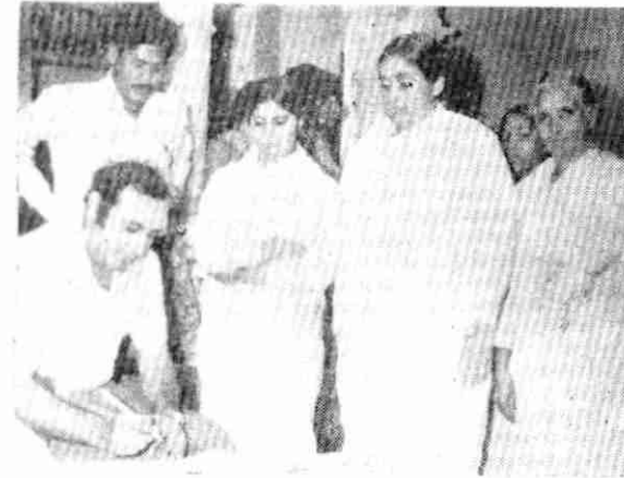
यह चित्र कलानौर में लगाई गई आध्यात्मिक प्रदर्शनी का है। वहाँ के चीफ मेडिकल आफिसर प्रदर्शनी का उद्घाटन करने के पश्चात् अपनी राय लिख रहे हैं।