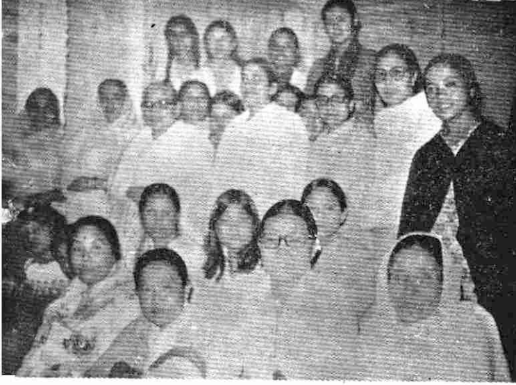
ऊपर का चित्र पन्दांम वस्ती (दार्जिलिंग) में आयोजित प्रदर्शनी एवं प्रवचनों के कार्यक्रम का है। ब्रह्मकुमारी बहनों का एक ग्रुप दिखाई दे रहा है।