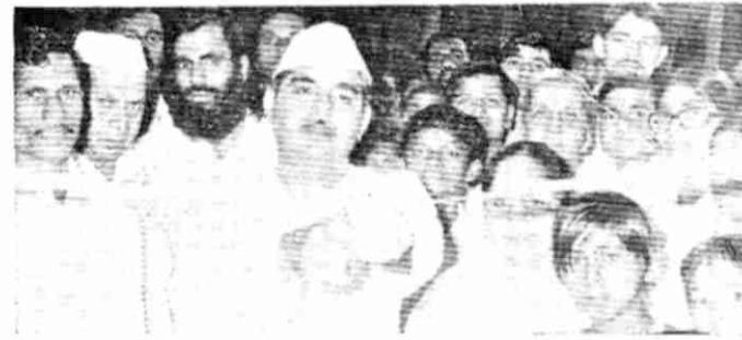
इस चित्र में कोल्हापुर में आयोजित राजयोग प्रदर्शनी का उद्घाटन वहाँ के प्रसिद्ध व्यापारी कर रहे हैं।