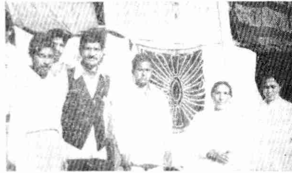
जोगिन्दर नगर में आयोजित प्रदर्शनी को देखने के पश्चात् कुछेक विशिष्ट व्यक्ति ब्र० कु० बहनों के साथ खड़े हैं।