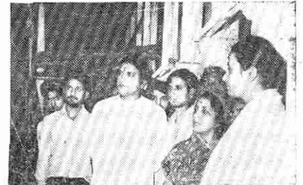
यह चित्र में आयोजित प्रदर्शनी के अवसर का है। वहाँ के