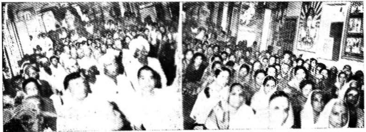
गडिगलजा (कर्नाटक) में जनता बड़े ध्यानपूर्वक आध्यात्मिक प्रवचन सुनते हुए

वक्त बचा है कम बच्चे पुरुषार्थ तेज चलाना । सम्पूर्ण बनने में देखो तुम पीछे मत रह जाना ॥ पीछे मत रह जाना, जल्दी-जल्दी दौड़ लगाना । मंजिल लम्बी है बाकी, धीरे धीरे मत चलना ॥ समय से पहले बता रहे हैं दोष न मुझ पर लगाना । ध्यान नहीं रखा अब भी तो पड़ेगा फिर पछताना ॥ (अव्यक्त बाप दादा की मुरली से उदधृत)