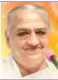
दादी हृदयमोहिनी अति.मुख्य प्रशासिका

बाबा कहता है पुरुषार्थ करके सम्पूर्ण बनना है, तो उसके लिए मेरे को अपने दिल में रख दो। बस। बाबा