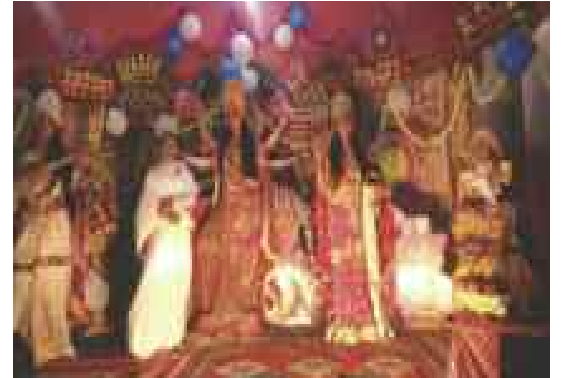
लहरिसरै-दरभंगा(बिहार) । चैतन्य देवियों की झाँकी में उपस्थित हैं ब्र.कु. आरती।