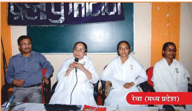
रेवा (मध्य प्रदेश)