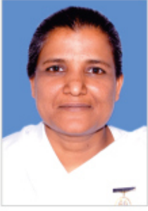
ब्र.कु. उर्मिला ज्ञानामृत प्रेस, शान्तिवन