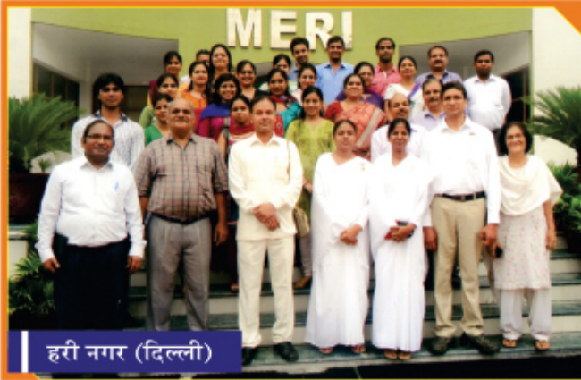
हरी नगर (दिल्ली)