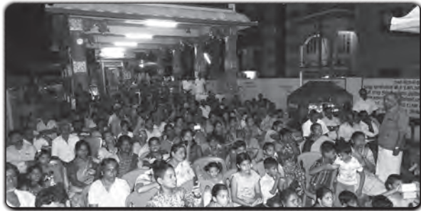
திருவள்ளூர்: தேவிகளின் தத்ரூப காட்சியினை கண்டு களிக்கும் பக்தகோடி மக்கள்