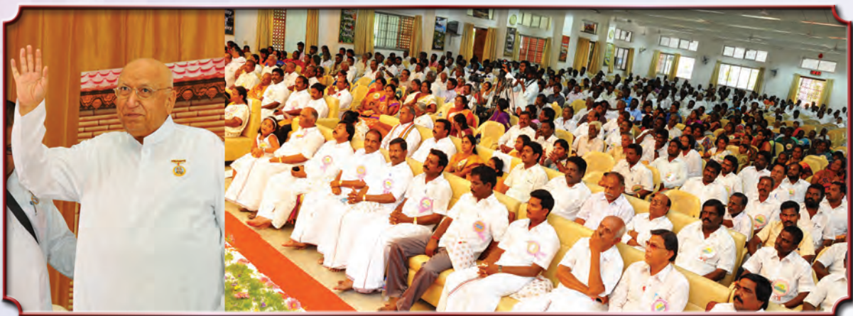
சென்னை: அரசியல் துறையை சார்ந்தவர்களுக்கான மாநாட்டில் பங்குபெற்ற அரசியல் துறையை சார்ந்த முக்கியஸ்தர்கள்.