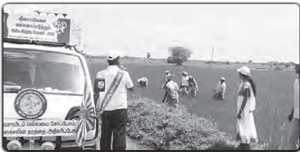
தஞ்சாவூர் (மனோஜ்பட்டி): விவசாயிகளை வல்லமைப்படுத்தும் அகில இந்திய பேரணியினர் விவசாயிகளுக்கு ஊக்கம் உற்சாகம் அளிக்கின்றனர்.