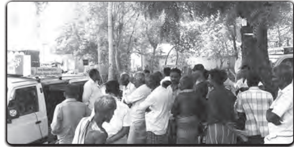
தஞ்சாவூர் (ரெட்டிபாளையம்): விவசாயிகளை வல்லமைப்படுத்தும் அகில இந்திய பேரணியினர் விவசாயிகளுக்கு ஊக்கம் உற்சாகம் அளிக்கின்றனர்