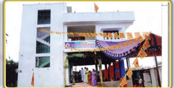
திண்டிவனம்: சமீபத்தில் பி.கு. பீனா அவர்களால் திறந்து வைக்கப்பட்ட புதிய கட்டிடம்.