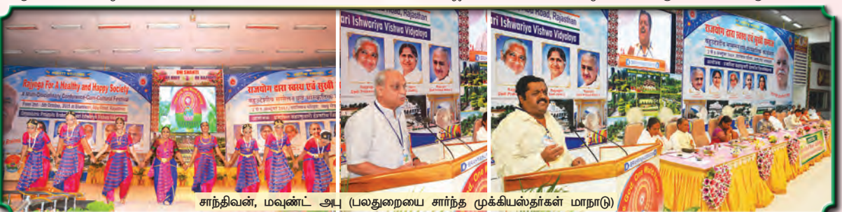
சாந்திவன், மவுண்ட் அபு (பலதுறையை சார்ந்த முக்கியஸ்தர்கள் மாநாடு)