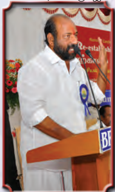
மாண்புமிகு அமைச்சர்: T.K.M. சின்னையா