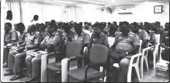
ஈரோடு: காவல்துறையை சார்ந்த அலுவலர்களுக்கு ராக்கி அணிவிக்கப்பட்டது.