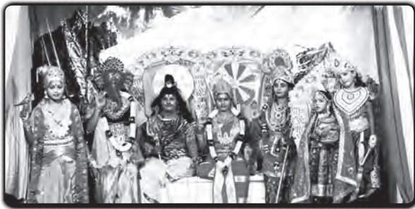
திருவள்ளூர்: நவராத்திரியை முன்னிட்டு தேவிகளின் தத்ரூப காட்சி விநாயகர்கோவிலில் நடத்தப்பட்டது