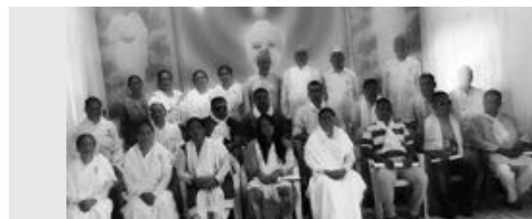
; v0 M0g l0ng sfogrd kZ ft \pBfu j f00b ; 0sf j l/7 pkWff kbz pkj L; lx; c@ g lg fr t k0lvs/lx?; F aks=ij i0F d.c@ .

ज्ञानी त्यो हो, जसको एउटा पनि संकल्प वा बोली व्यर्थ जाँदैन ।