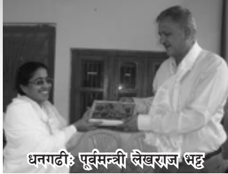
धनगढी: पूर्वमन्त्री लेखराज भट्ट

संस्थाका विभिन्न शाखा एवम् उपशाखाहरूमा आयोजित विशेष कार्यक्रमहरूमा विशिष्ट व्यक्तिहरूलाई ईश्वरीय सौगात प्रदान गरिदैं ।