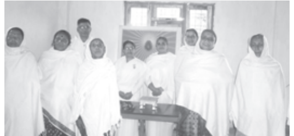
/f]gaf, , unilvafTds kj r g t yf cgej cfdg kbfg kZ ft \ j t f] /G lj 1 afaf/d ofj , als = ; lat f axgl, als = nrlt f lbdL yf cG