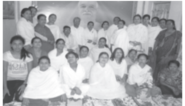
/8lvcvafTds kj r g kZ ft \ j t f] /G lj 1 afaf/d ofj , als = efgk sz kfh, als = ufff axgl, als = lgzf axgl nufot cG