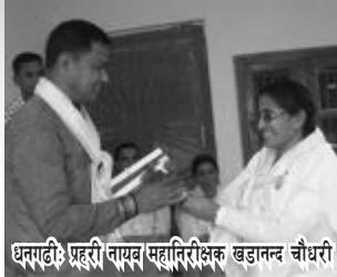
धनगढी: प्रहरी नायब महानिरीक्षक खडानन्द चौधरी