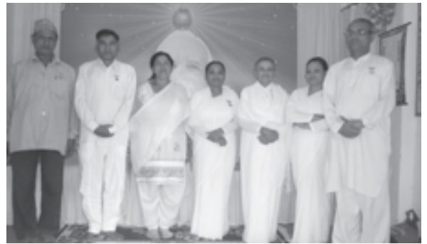
bds 8fMgk lchng stofra kZ ft \ gkn ; /sf/sf kj {pk ; lrj t yf j t f] /G lj 1 afaf/d ofj , als = t f axgl, als = efgk sz kfh nufot ; dth ; j L qp odgy /ldL zffG l3ld/] eu] it e66/fQ/ als = afaf axgl .