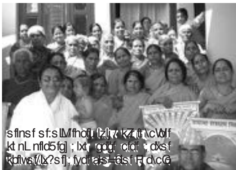
sfnsv sf:slmfofu lzj / kZ ft \cWff kt nL nfd5fgj ; lx; gqgr cid ; dXsf k0lvs/lx?s fj; fydras=0si F d.c@