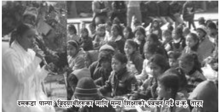
दमकडा पाल्पा: विद्यार्थीहरूका लागि मूल्य शिक्षाको प्रवचन गर्दै ब्र.कु. तारा