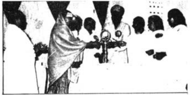
उज्जैन में आयोजित 'सर्व धर्म सम्मेलन' का उद्घाटन दूरध