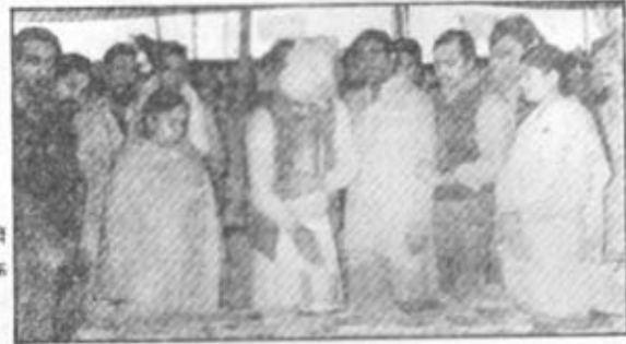
छानपुर (झालावाड़) में आयोजित 'अध्यात्मिक प्रदर्शनी' का उद्घाटन दृश्य।