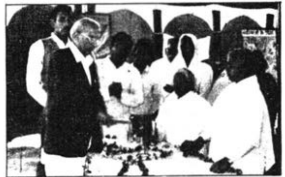
सिरसा - महाशिवरात्रि उत्सव पर आयोजित आध्यात्मिक प्रदर्शनी का उद्घाटन करते हुए प्राता हंसराज जी।