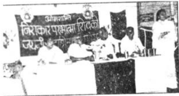
अकोला में आयोजित शिवजयन्ती महोत्सव में अपने शिवाच बयक्त करते हुए बहन पाटवटेकर।