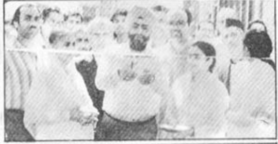
दिल्ली (काश्मीरी गेट) 'राजयोग शिविर' का उद्घाटन दृश्य।