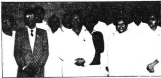
भारतपुर निकटवर्ती गीता पाठशाला सीपकों में शिवध्वजारोहण के पश्चात् भाई बहिन शिवस्मृति में छोड़े हुए।