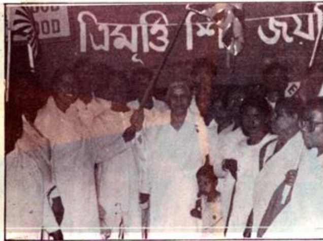
कलकत्ता — ५३ वीं महाशिवरात्रि के उपलक्ष्य में निकाली गई शांति-यात्रा का एक दृश्य