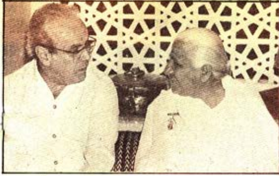
उदयपुर - संयुक्त राष्ट्र संघ के महासचिव धाता जावेर पिरिज डि० कम्युलर से दादी प्रकाशमणि, मुख्य प्रशासिका, ३० ई० वि० वि० सर्व के सहयोग से सुखमय संसार कार्यक्रम पर बातला करती हुई।