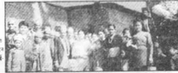
घौतास (नेपाल) - आध्यात्मिक प्रदर्शनी के उद्घाटन के अवसर पर उपस्थित भाई-बहन एक ग्रुप फोटो में।