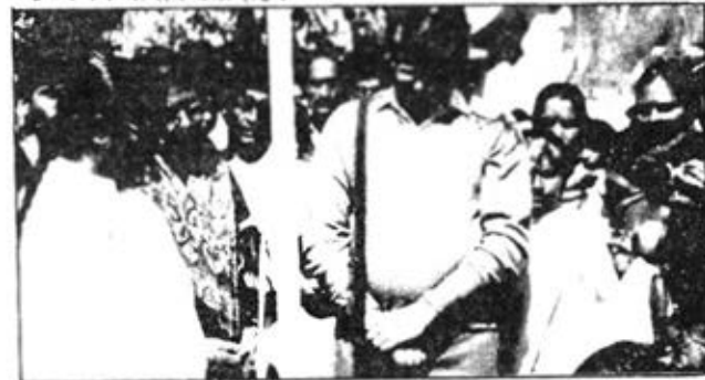
जम्मू: महाशिवरात्रि उत्सव पर शिवध्वजाग्रहण के पश्चात् सभी पार्ट-बहन शिव-स्मृति में खड़े हैं।