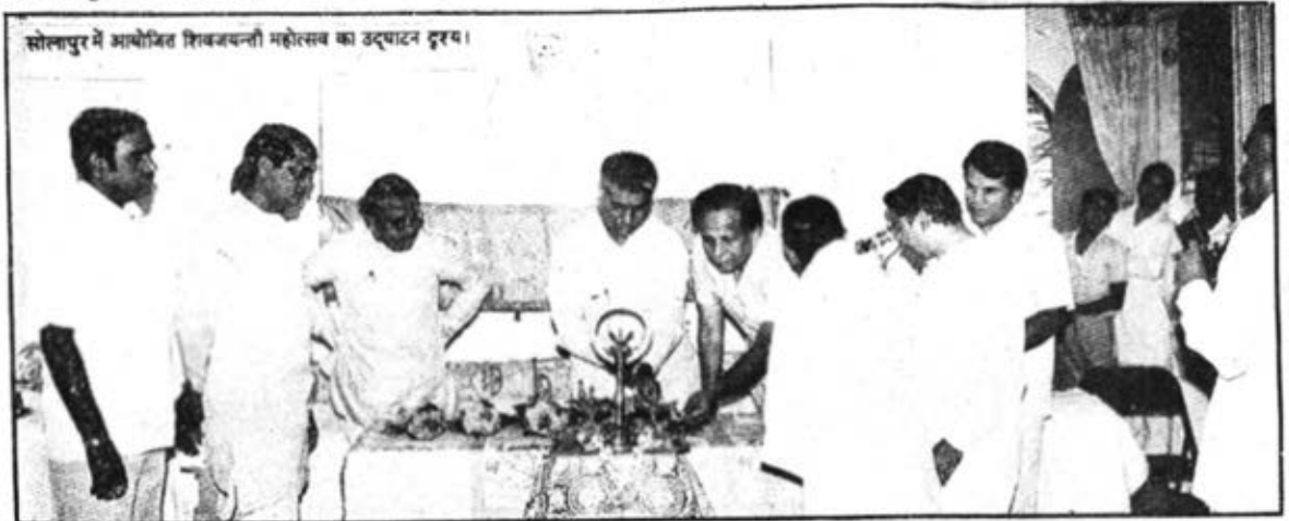
सोलापुर में आयोजित शिवजयन्ती महोत्सव का उद्घाटन दृश्य।

तो अब संगमयुग का वह समय आ गया जब हमें अपना धन ईश्वरीय सेवा में लगाकर २१ जन्म का राज्य भाग लेना है जिसकी ही यादगार यह कहानी है। अब नहीं तो कभी नहीं। याद रहे—यह हमारा अंतिम जन्म है, अब घर जाना है।