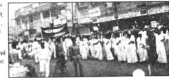
कन्यागण - महाशिवरात्रि पर्व पर नगर में निकाली गई शोभा यात्रा का एक दृश्य