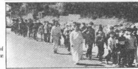
शिल्लोंग - महाशिवरात्रि पर्व पर निकली गई शान्ति-यात्रा का एक दृश्य।