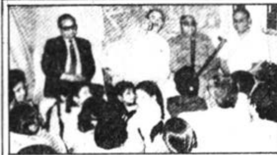
दिल्ली (दिलशाद गार्डन)- सेवाकेन्द्र पर आयोजित कार्यक्रम में श्रवण करते हुए ॐ कुं डॉन

करना। दूसरा लाभ यह होता है कि राजयोग द्वारा हमारा विशेष विश्वास शान्ति के प्रति बढ़ता है जिससे हम किसी से ईर्ष्या नहीं करते तथा किसी परिस्थिति में हम भयभीत नहीं होते तथा हमारा दृष्टिकोण बदल जाता है और हम कभी तनाव में नहीं रहते।