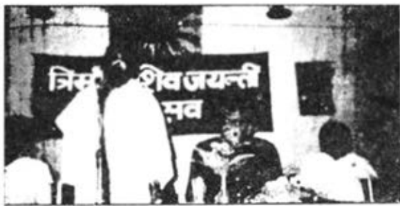
फरीदाबाद: शिवजयन्ति समारोह में प्रवचन करती हई ब० क० उपा बहिन