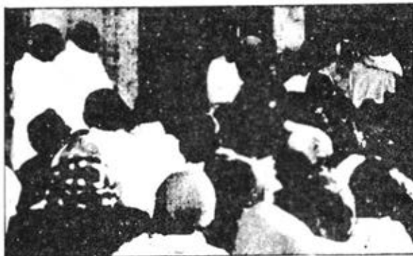
मुरादनगर में शिवजयन्ति महोत्सव के अवसर पर शिवध्वजा-ग्रहण करते हुए भ्राता वमां जी।