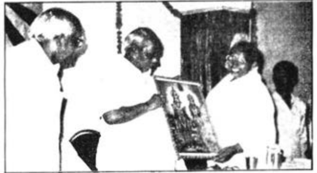
देहली (अशोक विहार) ३००० राज भ्राता दीप चन्द बन्धु मदस्य नगर निगम को श्री लक्ष्मी जी नारायण का चित्र भेंट करती हुई।