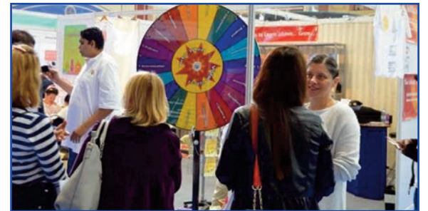
लंडन । एलेक्जेंडर पैलेस में 'ओम योगा शो और माइंड बॉडी स्पीरिट शो' के अंतर्गत ब्रह्माकुमारीज द्वारा आयोजित 'द ह्यूमन सोल कनेक्शन एंड द राजयोग एजीविशन' में शहर के लोगों को राजयोग मेडिटेशन के बारे में बताते हुए ब्र.कु. भाई बहनें।