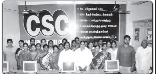
உடுமலைப்பேட்டை: கம்ப்யூட்டர் பயிற்சி நிலையத்தில் இராஜயோக தியானப்பயிற்சி அளிக்கப்பட்டது.