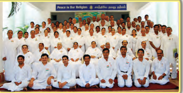
சென்னை (ஹேப்பி வில்லேஜ்): போக்குவரத்து துறை மற்றும் பயணத்துறைக்கான வருடாந்திர தேசிய கூட்டத்தில் கலந்து கொண்ட அகில இந்திய உறுப்பினர்கள்