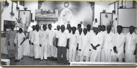
சென்னை: யோகமுறையில் விவசாயம் செய்வோம் என உறுதிமொழி எடுத்த பி.கு. சகோதர சகோதரிகள்