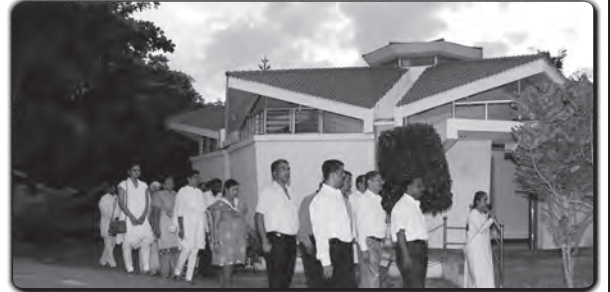
சென்னை (ஹேப்பி வில்லேஜ்): ஆன்மீக சுற்றுலா எனும் நிகழ்ச்சியில் வெளி மாநிலத்திலிருந்து வந்து கலந்து கொண்ட குழுவினரு சிறப்பு பயிற்சி அளிக்கப்படுகிறது.