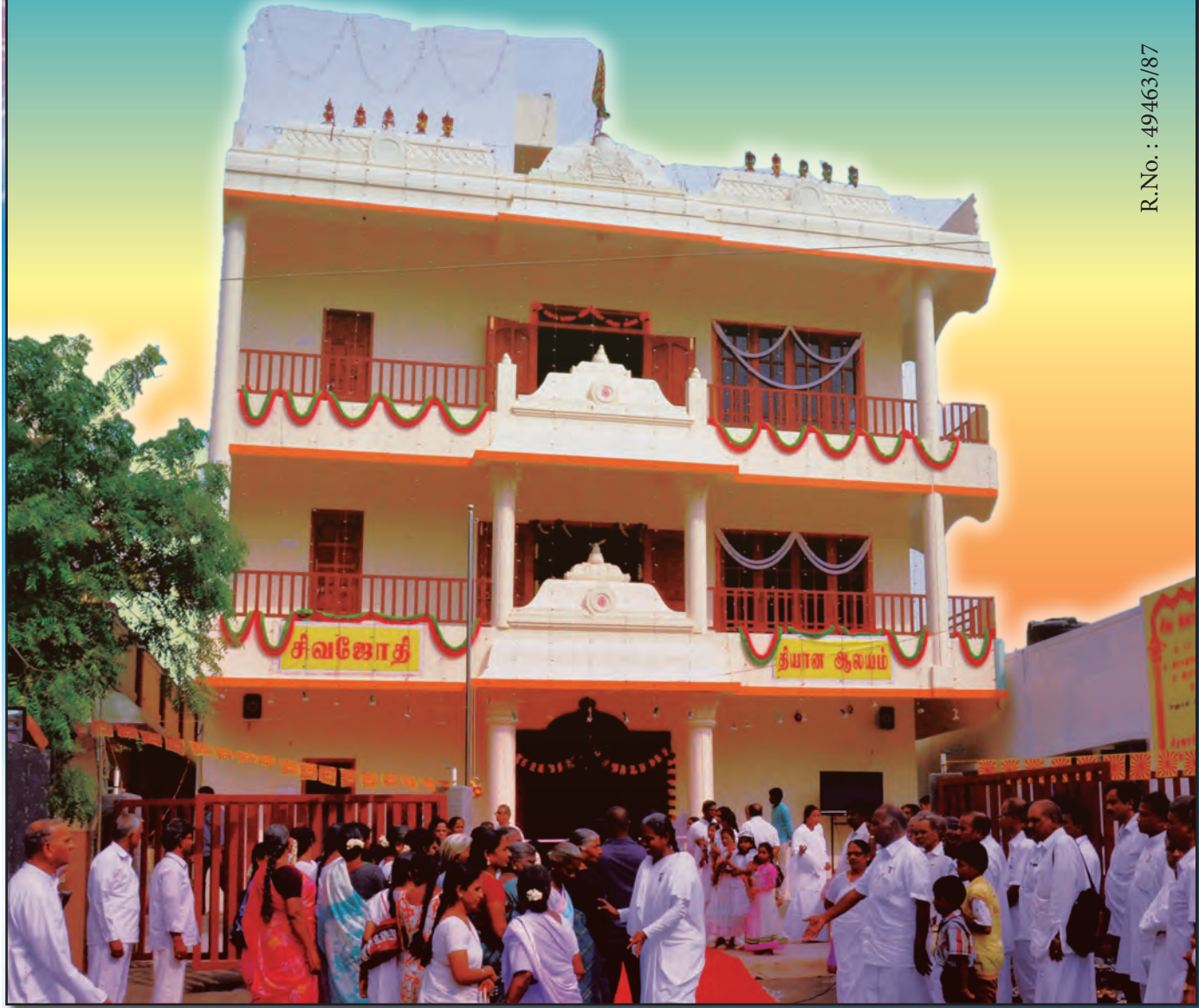
திருவண்ணாமலை: கிரிவல பாதையில் பக்தகோடிகளுக்கான சேவைக்காக புதியதாக கட்டப்பட்ட சிவஜோதி தியான ஆலயம்