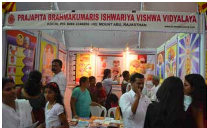
കൊച്ചി ജവഹർലാൽ നെഹ്രു സ്റ്റേഡിയത്തിൽ ഫെബ്രു. 21 മുതൽ 26 വരെ നടന്ന ഗ്ലോബൽ ആയുർവ്വേദിക് ഫെസ്റ്റിവലിൽ ബ്രഹ്മാകമാരീസ് കൊച്ചി സംഘടിപ്പിച്ച ഹെൽത്ത് എക്സിബിഷൻ.