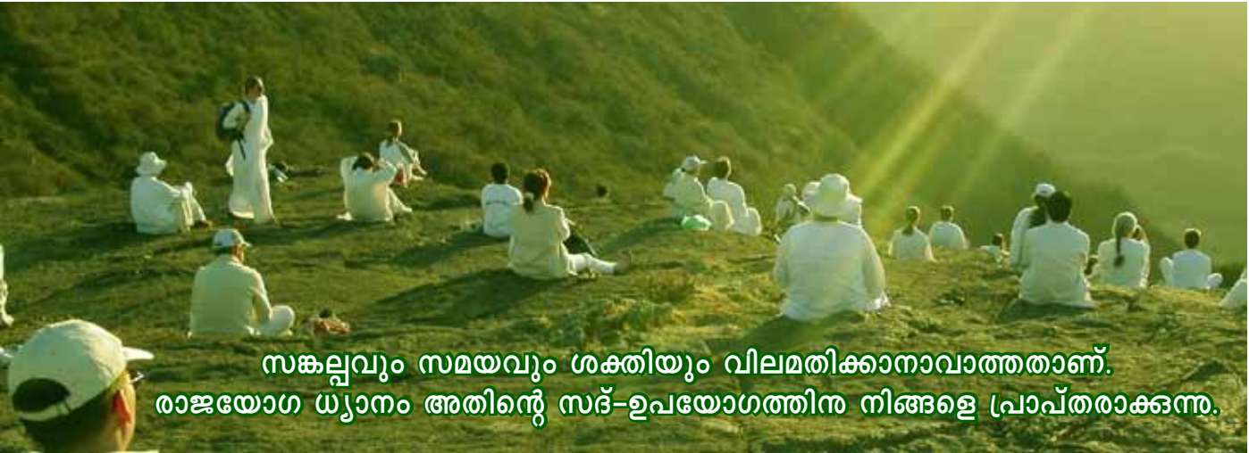
സങ്കല്പവും സമയവും ശക്തിയും വിലമതിക്കാനാവാത്തതാണ്. രാജയോഗ ധ്യാനം അതിന്റെ സദ്-ഉപയോഗത്തിന് നിങ്ങളെ പ്രാപ്തരാക്കുന്നു.

വൃത്തിയാക്കിയ ഈ മുറ്റം നോക്കൂ. ഇതൊരു ജോലിയല്ല, ഒരു ഒഴുക്കാണ്. കുറെ കാലം കഴിഞ്ഞാൽ ഇത് പിന്നെയും പഴയ പോലെ ആകും. അപ്പോൾ ഞാൻ വീണ്ടും ഇത് വൃത്തിയാക്കും. മാസങ്ങളോളം, വർഷങ്ങളോളം ഞാനിത് ചെയ്യും. എനിയ്ക്കറിയാം ജീവിതം ഒരു ഒഴുക്കാണ്. അത് കാരണം എനിയ്ക്ക് ചോദ്യങ്ങൾ, സ്വാർത്ഥത, ലാഭം, നഷ്ടം ഇതൊന്നും ഉണ്ടാകില്ല. അതുകൊണ്ട് തന്നെ ദേഷ്യം, അഹംഭാവം, നിരാശ ഇതൊന്നും എന്റെ മനസ്സിലേക്ക് ഒരിക്കലും വരുന്നില്ല.