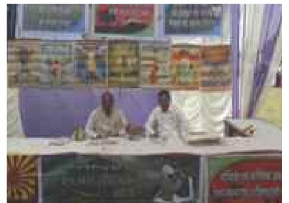
झालावाड़-राज.। कृषि विज्ञान केन्द्र में विश्व मृदा दिवस पर ब्रह्माकुमारीज़ के ग्राम विकास प्रभाग की ओर से लगाई गई शाश्वत यौगिक खेती की प्रदर्शनी।