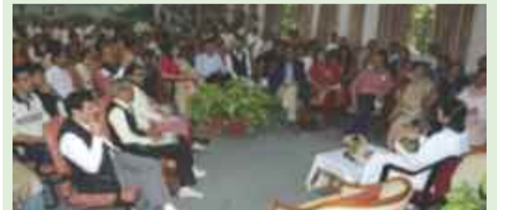
कार्यक्रम में शिक्षाविदों को सम्बोधित करते हुए मोटिवेशनल स्पीकर ब्र.कु. शिवानी।

सुप्रसिद्ध मोटिवेशनल स्पीकर ब्र.कु. शिवानी ने कहा कि जो भी हम खुश रहकर करते हैं, वो कार्य हमें खुशी प्रदान करता है। लेकिन परेशान होकर कार्य करने से हम छोटी-छोटी परिस्थितियों से घबरा जाते हैं। परिस्थितियाँ कम हो जाएं ऐसा सोचते हैं, लेकिन मन की शक्ति को नहीं बढ़ाना चाहते। लेकिन यदि आप मन को नियंत्रित करते हैं तो किसी भी परिस्थिति को नियंत्रित कर सकते हैं।