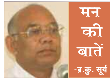
मन की बातें -ब.कु.सूर्य

प्रश्न - मैं आपसे एक पर्सनल प्रश्न पूछना चाहता