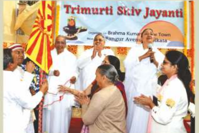
कोलकाता (न्यू टाऊन) - न्यू टाऊन सेवाकेन्द्र पर आयोजित शिवरात्रि महोत्सव में शिवध्वजारोहण करते हुए ब्र.कु. मुन्नी बहन, ब्र.कु. मधु, ब्र.कु. पदमा बहन एवं अन्य।