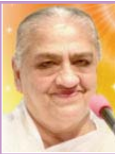
दादी हृदयमोहिनी अति.मुख्य प्रशासिका