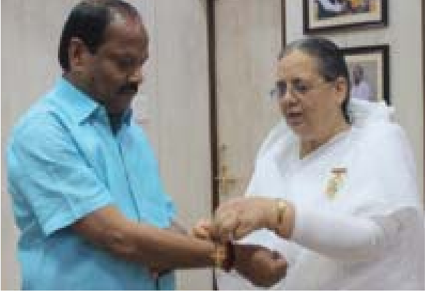
राँची । झारखण्ड के माननीय मुख्यमंत्री रघुवरदास जी को रक्षासूत्र बांधते हुए ब्र.कु. निर्मला।