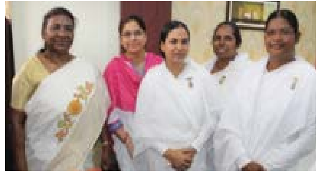
निरसा-धनबाद(झारखण्ड)। झारखण्ड की राज्यपाल द्रौपदी मुरमू के निरसा आगमन पर उनसे मुलाकात के दौरान चित्र में राज्यपाल के साथ ब्र.कु. शक्ति, ब्र.कु. जया, डॉ. अवंतिका एवं ब्र.कु. समता।

रह सकते हो और मुझे लगता है कि तुम बहुत थक गये हो, इसलिए तुम जाकर हाथ-मुँह धो लो, मैं तुम्हारे खाने और सोने का प्रबंध करता हूँ'। इसपर चोर पादरी का आभार व्यक्त करते हुए स्नानघर की ओर बढ़ गया और इतने में पादरी ने उसके खाने और सोने की व्यवस्था कर दी। रात को सभी के सो जाने के बाद चोर के मन में चोरी की इच्छा जागृत हुई और वह पादरी के घर से सोने के दो दीपदान चुराकर वहाँ से निकल भागा। रात में पुलिस उसकी तलाश में ही थी, सो वो उनके हत्थे चढ़ गया। पूछताछ में उसने बता दिया कि मैंने ये पादरी के घर से चुराए हैं, इस पर उसे पादरी के सामने लाया गया तो पादरी ने पुलिस वालों से कहा, 'आप कृपया इन्हें छोड़ दीजिये, ये मेरे घर में मेहमान के तौर पर आये थे, और मैंने ही ये दीपदान इन्हें उपहार रूप में दिये हैं'। इतने में चोर के ज्ञानचक्षु खुल गये और उसे अपनी भूल का एहसास होने लगा। पादरी की उदारता देखते हुए चोर के मन में पश्चाताप होने लगा और उसने माफी मांग कर कभी फिर से चोरी नहीं करने का वचन दिया।