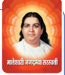
मातेश्वरी जगदम्बा सरस्वती

ड्रामा पर निश्चय .... मम्मा का शिव बाबा के साथ-साथ ड्रामा के ऊपर भी अटल