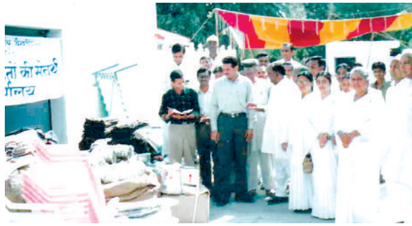
● आपदा के समय जरूरतमंदों को कंबल का वितरण करती संस्थान की दायियां व विरिष्ठ भाई-बहनें।