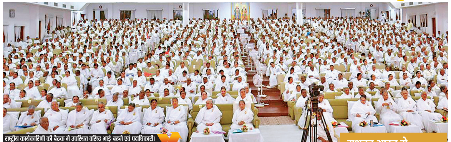
राष्ट्रीय कार्यकारिणी की बैठक में उपस्थित वरिष्ठ भाई-बहनें एवं पदाधिकारी।