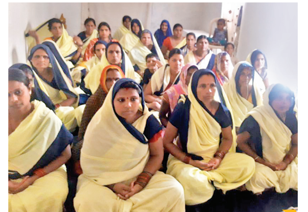
जेल के अंदर महिला कैदी राजयोग मेडिटेशन करते हुए।