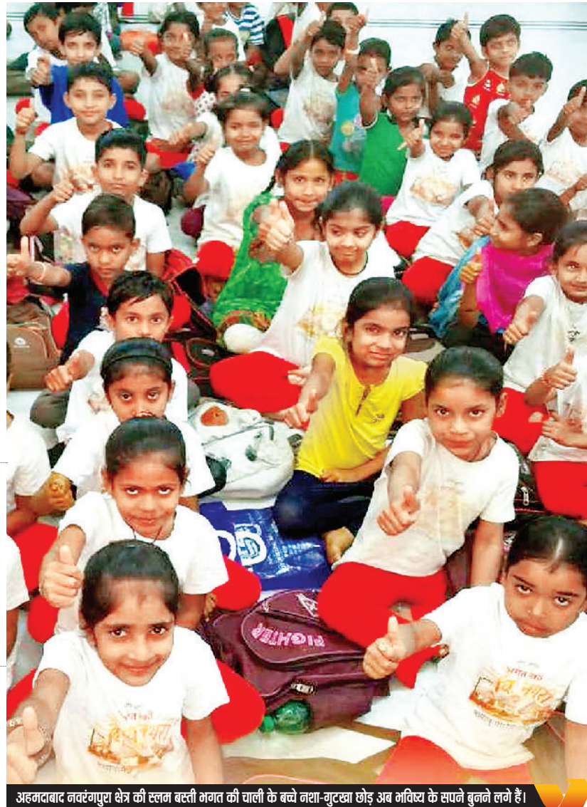
अहमदाबाद नवरंगपुरा क्षेत्र की स्लम बस्ती भगत की चाली के बच्चे नशा-गुटखा छोड़ अब भविष्य के सपने बुनने लगे हैं।

▶ डी. थारा आईएएस, यूनिसेफ कॉर्पोरेशन, अहमदाबाद