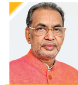
राममोहन सिंह केंद्रीय कृषि मंत्री भारत सरकार

जैविक-योगिक खेती से फसलों की उत्पादकता बढ़ेगी। इससे किसानों की आय बढ़ेगी और देश की आर्थिक व्यवस्था मजबूत होगी। वर्ष 2022 तक खेती को फायदे का सौदा बनाने का लक्ष्य है। सकारात्मक सोच का प्रकृति के साथ-साथ पशुधन विकास पर बहुत असर पड़ता है। हालांकि, कुछ लोगों को इस पर यकीन नहीं आता, लेकिन यह वैज्ञानिक सत्य है। सरकार ने योगिक खेती के विकास को समर्थन देने का प्रस्ताव बनाया है, ताकि किसानों का खेती के पारंपरिक तरीकों की ओर रुझान बढ़े।