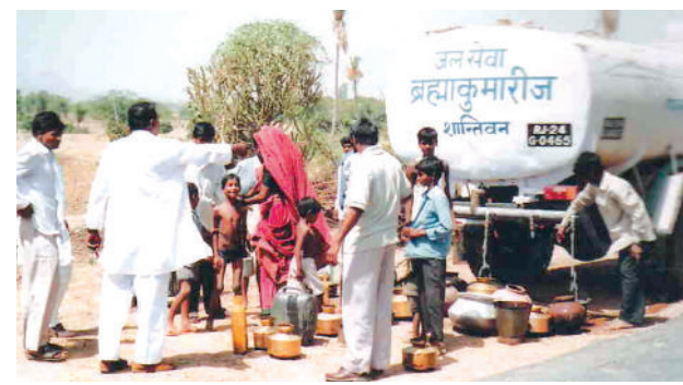
● सूखे के समय राजस्थान के गांवों में संस्थान द्वारा टैंकरों से जल वितरण किया जाता है।

संस्थान का अंतरराष्ट्रीय मुख्यालय माउंट आबू में स्थित है। चूंकि राजस्थान में गर्मी के मौसम में हर साल गांवों में पानी का भीषण संकट खड़ा हो जाता है। ऐसे में संस्थान द्वारा टैंकर के माध्यम से संकटग्रस्त लोगों को जल वितरण किया जाता है। साथ ही इस क्षेत्र में होने वाले बड़े समारोहों में पानी की व्यवस्था की जिम्मेदारी संस्था बखूबी निर्वहन करती रही है। इस योगदान के लिए मुख्यमंत्रियों से प्रशस्ति-पत्र एवं सराहना मिलती रही है। इसके अलावा कई बार राजस्थान में सूखे की स्थिति में राज्य सरकार ने भी चारा एवं पानी वितरण की व्यवस्था संस्थान को दी है, जिसे बखूबी निभाया गया है।