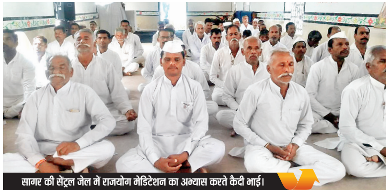
सागर की सेंट्रल जेल में राजयोग मेडिटेशन का अभ्यास करते कैदी भाई।

जेल के अंदर रोज सुबह आध्यात्मिक सत्संग होता है। इसमें जेल शिक्षिका कैदियों को ईश्वरीय महावाक्य पढ़कर सुनाती हैं, जिसमें रोज ज्ञान की अच्छी-अच्छी बातें होती हैं। साथ ही उन्हें रोज किसी एक विषय पर होमवर्क में चिंतन करने के लिए दिया जाता है। जेल में कुछ कैदी सुबह 4 बजे से ही ध्यान लगाते हैं। साथ ही शाम को भी ईश्वरीय ध्यान करते हैं। जेल में कैदियों की अध्यात्म के प्रति रुचि देख अधिकारियों ने संतुष्टता व्यक्त की।