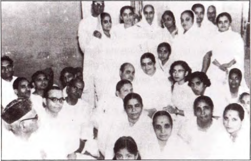
मातेश्वरी जी के साथ दादी गुलजार, सावित्री बहन तथा लखनऊ के भाई-बहनें।