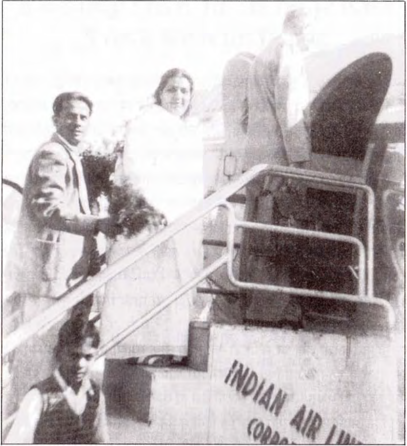
हवाई जहाज की सीढ़ियाँ चढ़ती मातेश्वरी जी