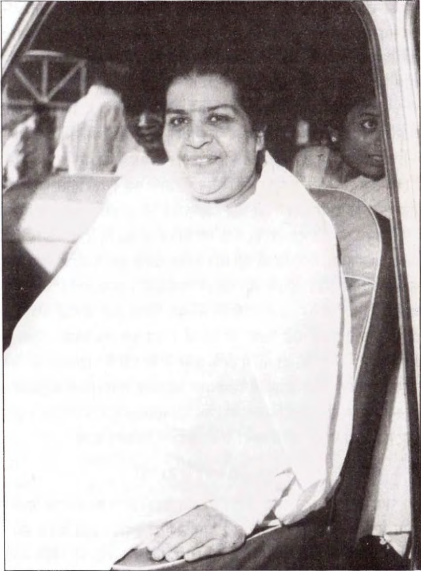
जिम्मेवारियों के होते सदा निश्चिन्त माँ

बच्ची, तुम मम्मा को पहचानती हो? मैंने कहा, बाबा हमने मम्मा को देखा ही नहीं तो पहचानें कैसे? बाबा ने कहा, देखो बच्ची, कल मम्मा आ रही है, उनको