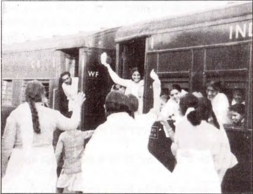
विदाई की वेला, तृप्ति की मुस्कान।

मातेश्वरी जी से सब सन्तुष्ट थे और मातेश्वरी जी भी सभी से सन्तुष्ट थी। मातेश्वरी जी किसी के भाव-स्वभाव के प्रभाव में नहीं आती थीं। सबको प्रेम से जीतती थीं इसीलिए कोई उनको पराया नहीं समझता था। ईश्वरीय ज्ञान की नयी बातों को न मानने वाले भी मातेश्वरी जी के व्यक्तित्व (Personality) की महिमा करते थे। उन्हें सभी अपनी माँ समझते थे। ❀