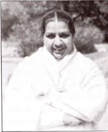
करुणा पूरित माँ सरस्वती