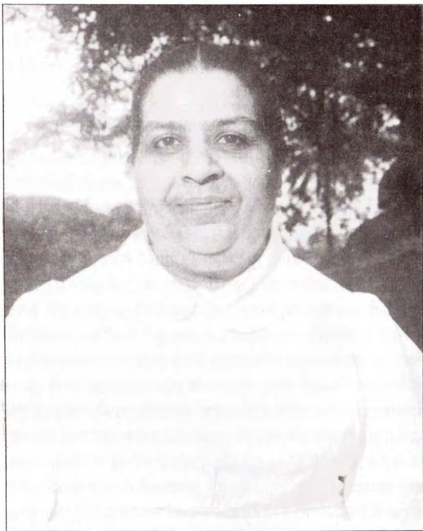
दिव्य तेज बिखेरती हुई माँ सरस्वती

गयी। वह मुझे निहारने लगी और दृष्टि देने लगी। मैं एकदम हल्कापन अनुभव करने लगी। थोड़ी देर बाद उन्होंने मुझसे पूछा, “बच्ची, कैसी हो, कहाँ से आयी हो?” मैंने कहा, “मैंने आपको बचपन में स्वप्न में देखा था और आज मैं सचमुच जागते हुए आपसे मिल रही हूँ, आपको देख रही हूँ, अहो सौभाग्य