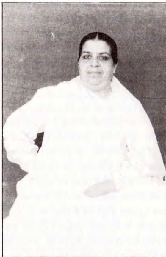
योगस्थ माँ सरस्वती

में दो रूप देखती थीं— एक परम पिता का और दूसरा जगत पिता का। मम्मा ने बाबा को पूरा-पूरा जान लिया था कि ब्रह्मा बाबा में कौन बैठा है, कौन यह महान् ज्ञान सुना रहा है।