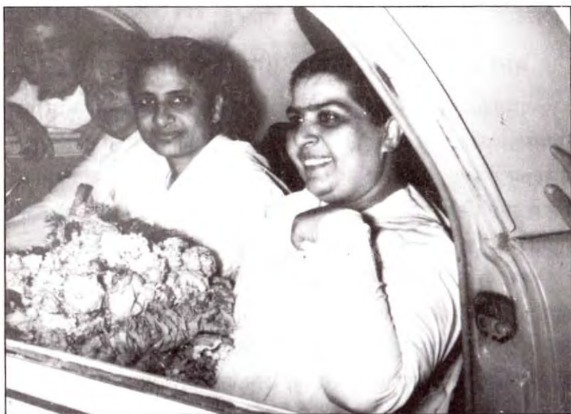
जग को हषनि वाली माँ जगदम्बा