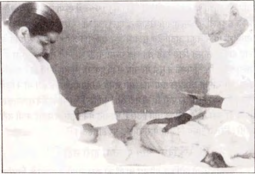
बच्चों के पत्र पढ़ते हुए मम्मा और बाबा।

अच्छा भी बहुत लगता था। एक दिन अचानक ही वह सुबह-सुबह क्लास में आ गया जब मम्मा की मुरली चल रही थी, वह बड़े ध्यान से मुरली सुनता रहा। अन्त में वह उठकर बोला, माँ मुझे माफ़ कर दो, ऐसे कहकर उसने रोना शुरू कर दिया। मम्मा ने उसे ममतामयी दृष्टि दी। उसने मम्मा से बहुत माफ़ी माँगी। अपनी यह कमजोरी मम्मा के आगे रख दी और कहा कि मुझे इस बुराई से छुड़ा दो। तब मम्मा ने कहा कि यह कमी मुझे दे दो। इस प्रकार, उस व्यक्ति का उद्धार हो गया। मम्मा सबके कष्ट, स्नेहमयी दृष्टि और शुभभावना से दूर कर देती थी। मैं 6 मास मधुबन में रही जहाँ मम्मा ने मुझे अपनी मीठी शिक्षाओं से निर्भयता का और सच्चाई का गुण सिखाया। मम्मा कहती थी, यज्ञ माता-पिता के साथ सच्चा रहने से तुम्हारा जीवन श्रेष्ठ बन जायेगा। ऐसे, हमारी मातेश्वरी हर तरह की शिक्षा दिया करती थीं।