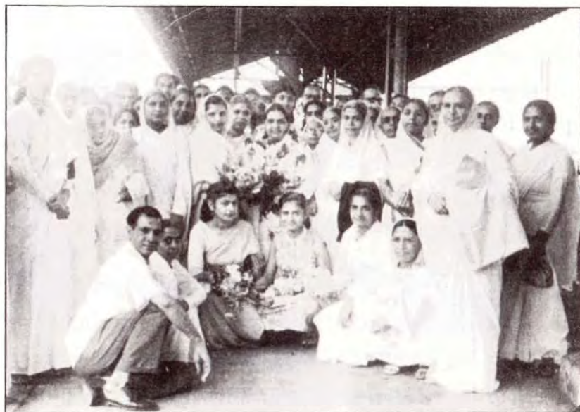
मुंबई- मातेश्वरी जी के साथ शील दादी, पुतलु बहन, दैवी माता, वृजेन्द्रा दादी, दादी जानकी। नीचे बैठे हैं सन्तरी दादी, क्वीन मदर और अन्य।