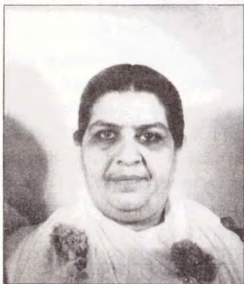
तेजस्वी और ओजस्वी मूरत माँ सरस्वती