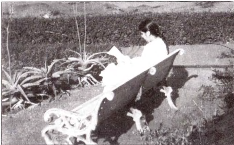
ज्ञान-बिन्दुओं के पठन और मन्थन में तल्लीन माँ

की डायरी से उन ज्ञान-बिन्दुओं को अपनी डायरी में लिखा था, वह डायरी हमें पढ़ने के लिए मिली थी। उन ज्ञान-बिन्दुओं को पढ़कर मुझे लगा कि मम्मा ने ज्ञान का कितना विचार सागर मंथन किया होगा, कितना ज्ञान की गहराई में गयी होगी और कितना उनको धारणा करने का अभ्यास किया होगा! विद्यादेवी सरस्वती का वर्णन तो कवि, विद्वानों ने किया है लेकिन उस विद्यादेवी के रूप और कर्तव्य को हमने अपनी आँखों से देखा है, उनसे सीखा और उस माँ के बच्चे बने— यह हमारा परम सौभाग्य है।