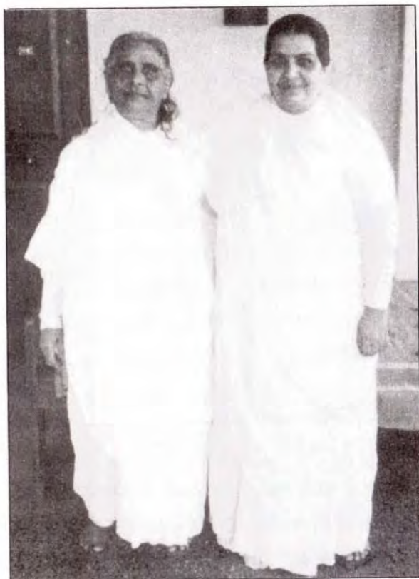
मातेश्वरी जी और उनकी लौकिक माता रोचा जी

से सबको रबड़ी खिलायी। कैसा प्यार-दुलार था उस माँ का, मुझसे तो वर्णन ही नहीं किया जाता !