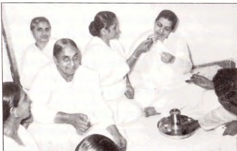
मुंबई— विद्वानी बहन, प्रकाशमणि दादी, रजनी बहन और मम्मा।

कहा, “मम्मा, बाबा चाहते हैं कि मैं सेवा पर जाऊँ। मेरे में वो शक्ति नहीं है कि मैं बाबा से दूर रहूँ! मुरली सम्मुख सुनने के बदले कागज़ पर पढ़ूँ! यह मेरे से नहीं हो सकता। मैं तो वहाँ रोती रहूँगी और रोती रहूँगी तो सेवा कैसे करूँगी?” तब मम्मा ने कहा, “देखो बच्ची, जब बाबा तुमसे सेवा चाहता है तो वे ज़रूर तुम्हें शक्ति देंगे, डरो नहीं। बाबा को ‘हाँ’ कहो, कुछ नहीं होगा, सब ठीक हो जायेगा।” ऐसे समझा कर मेरे में ताकत और उत्साह भर कर मम्मा बाबा के पास ले गयी और बाबा से कहा कि कुँज सर्विस पर जाने के लिए तैयार है। मगर मैं एकदम चुप रही। बाबा ने कहा, वह कहाँ बोलती है? चुपचाप खड़ी है! तो मैं धीरे-धीरे बोली, बाबा मैं सर्विस पर जाने के लिए तैयार हूँ। मम्मा एक माँ की तरह मेरे में धैर्य, उमंग, उल्लास भरकर बाबा के पास ले गयी और सेवा में आगे बढ़ने का सुअवसर प्रदान किया। इस प्रकार, मम्मा सब तरह की ट्रेनिंग देती थी।