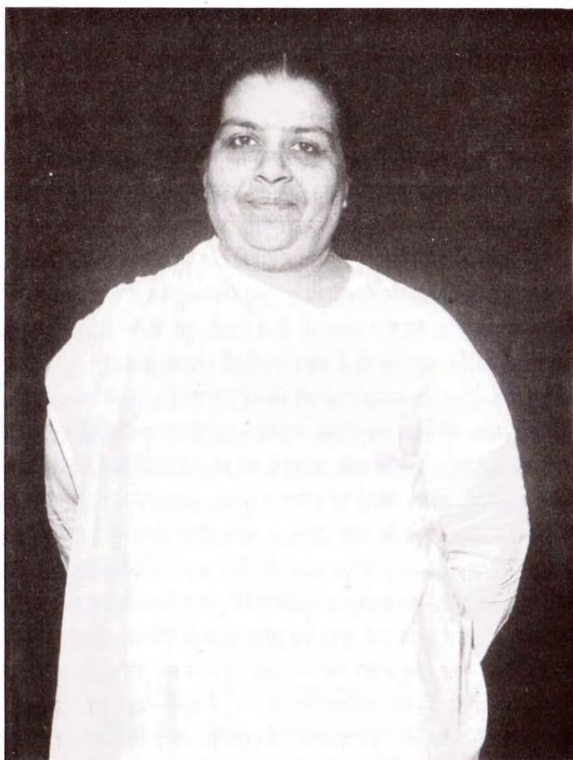
साक्षात्कार मूर्त माँ जगदम्बा

भी यज्ञवत्सों का गुणों से शृंगार करके बाबा के सामने ले जाती थी।