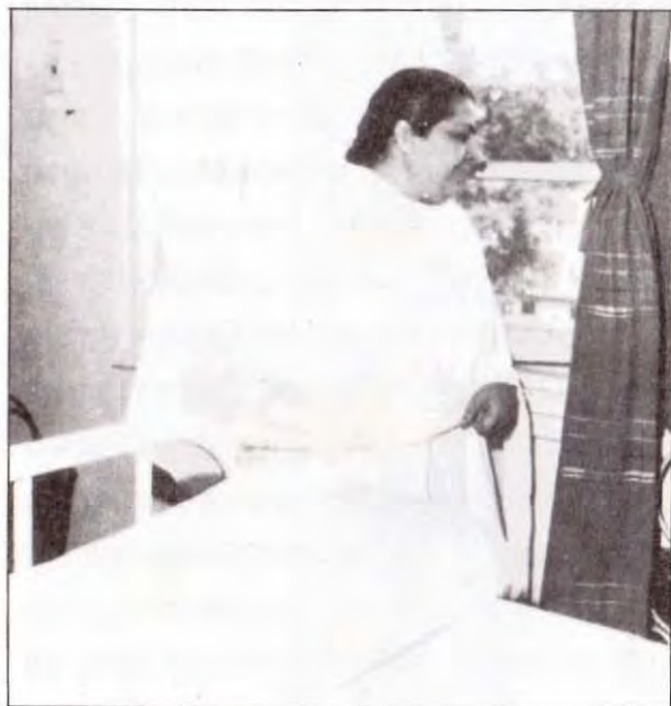
अन्तिम क्षण तक जग को सकाश देने वाली जगत् माँ

मम्मा शरीर छोड़ने वाली नहीं होगी, तो बाबा बता देंगे कि मम्मा शरीर नहीं छोड़ने वाली है और यह भी बता देंगे कि कैसे बाबा उनको आबू में नयी-नयी