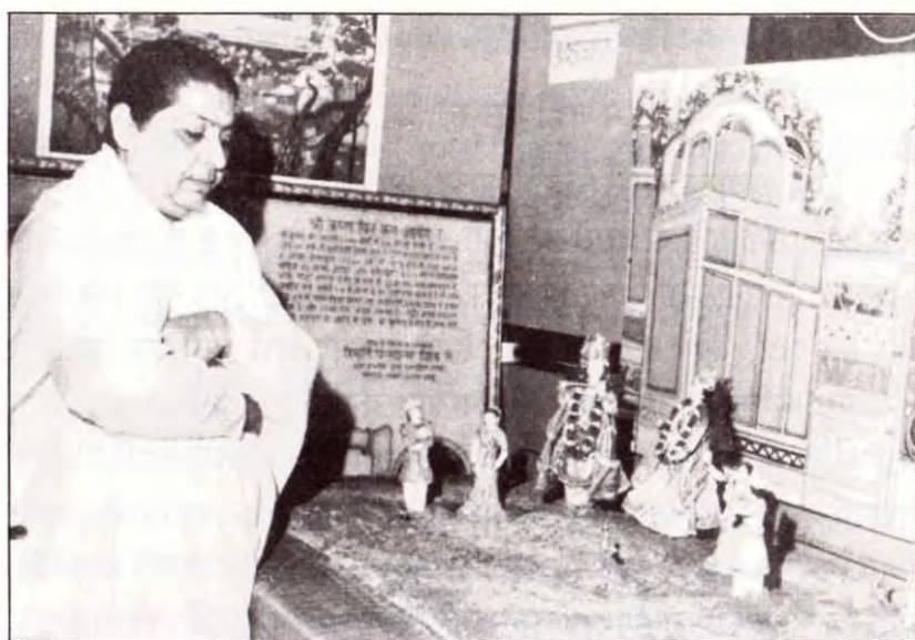
मुंबई — प्रथम विश्व नव निर्माण आध्यात्मिक चित्र प्रदर्शनी का अवलोकन करते हुए मातेश्वरी जी।

हंगामे के बारे में बाबा को समाचार सुना रही थी। मैं भी वहीं था। मम्मा, बाबा को सुना रही थी कि वहाँ के विरोधी लोगों ने क्या किया, कैसे किया आदि-आदि। बाबा शान्तचित्त होकर सुन रहे थे, मम्मा एकरस होकर बता रही थीं। मैं भी उनका वार्तालाप सुन रहा था। सुनता रहा। मेरे मन में एक प्रश्न उठा। बाद में मैंने मम्मा से पूछा, “मम्मा, आप खुद हापुड़ की परिस्थिति देख कर आयी हैं और वो सारी बातें बाबा को सुना भी रही हैं। जब आप ये सब देख रही थीं तो क्या आपके मन में कोई हलचल आदि उत्पन्न हुई थी?” मम्मा ने कहा, “मुझे कोई हलचल नहीं होती है।” फिर मैंने पूछा, “क्यों नहीं होती है?” मम्मा ने बाबा को देखते हुए बताया, “एक बात का हमें पक्का निश्चय है कि 5000 वर्ष पहले जैसे स्थापना हुई थी, अब भी वैसे ही हो रही है। अभी जो उतराव-चढ़ाव, विघ्न-परिस्थिति आदि आ रही हैं वे 5000 वर्ष पहले भी आयी थीं। ऐसी कई बातें आयेंगी और जायेंगी। इसलिए इन बातों से हमारी अवस्था नहीं बिगड़ती है और हम भी हलचल में नहीं आते हैं।” इस प्रकार, ड्रामा के ऊपर