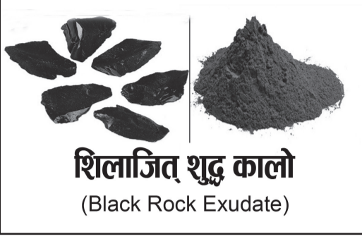
शिलाजित् शुद्ध कालो (Black Rock Exudate)

परिचय : गर्मी महिनाताका चैत्र-साउनमा भित्रीचट्टान पगिएर शिलालाई जितेर बाहिर आउने रसलाई शिलाजित् कालो भनिन्छ । फलाम-लौहखानीबाट निकलिएको/रसाएको पत्थर-ढुङ्गालाई भेदन गरी मूल फुट्ने यो शिलारस प्रायः असजिलो तारेभिर-पहरामा पाइन्छ । ढुङ्गा माटो सहितको यो शिलाजित्लाई ल्याएर हरो, बरो, अमला, भृङ्गराज, पाखनभेद, गुर्जो या काउलोलाई चर्ने गाईको मूत्रमा अथवा रोगानुसारको जडीबुटीको रसमा राखी/घोली सड्लो भएपछि छानेर पकाइन्छ वा