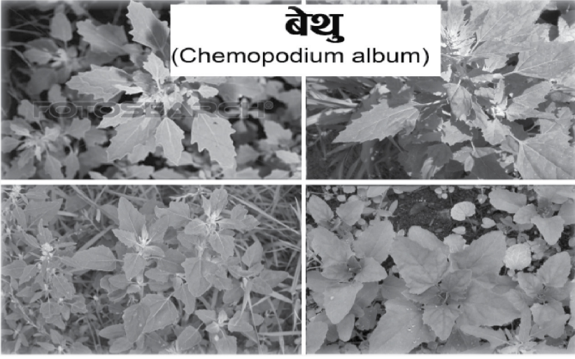
बेथु (Chemopodium album)

यो हरियो साग हो । यसले पथरी हुनबाट बचाउँछ । बेथेले आमाशयलाई बलवान् बनाउँदछ, गर्मीका कारण बढेको यकृतलाई ठीक पार्छ । यसमा लोहा, पारा, सुन, क्षार पाइन्छ । बेथेको साग जति धेरैभन्दा धेरै सेवन गरिन्छ, त्यति नै निरोगी रहनमा सहायता पुऱ्याउँछ । बेथेको सागलाई खाँदा मसलाको प्रयोग कमभन्दा कम गर्नु राम्रो हो । नून नराखेको धेरै राम्रो, यदि स्वादका लागि राख्नुपऱ्यो भने सिधै नूनको प्रयोग गरौं । गाइको वा भैंसीको दूधको छौंङ्क लगाऔं । बेथेको उमालिएको रस राम्रो हुन्छ । कुनै पनि हिसाबले बेथेको नित्य सेवन गरौं ।