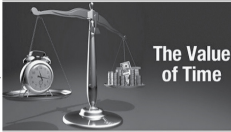
The Value of Time

नैतिक भ्रष्टताका कारण मानवले दुःखी हुन नपरोस् ।