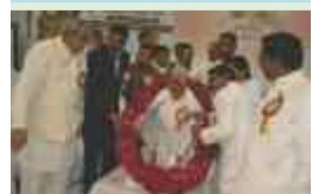
इस अवसर पर मानवाधिकार संगठन के सदस्यों द्वारा दादी को पचास किलो गुलाब के फूलों की माला पहनायी गई।